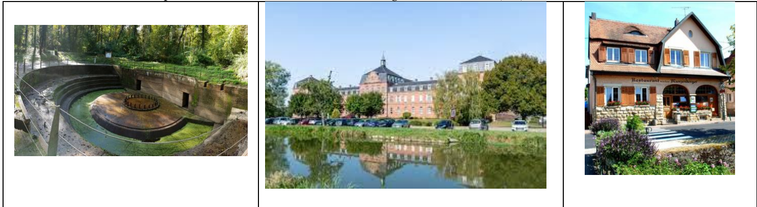
Grand Canon à Zillisheim