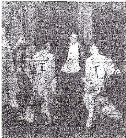
« accrocher » son public.